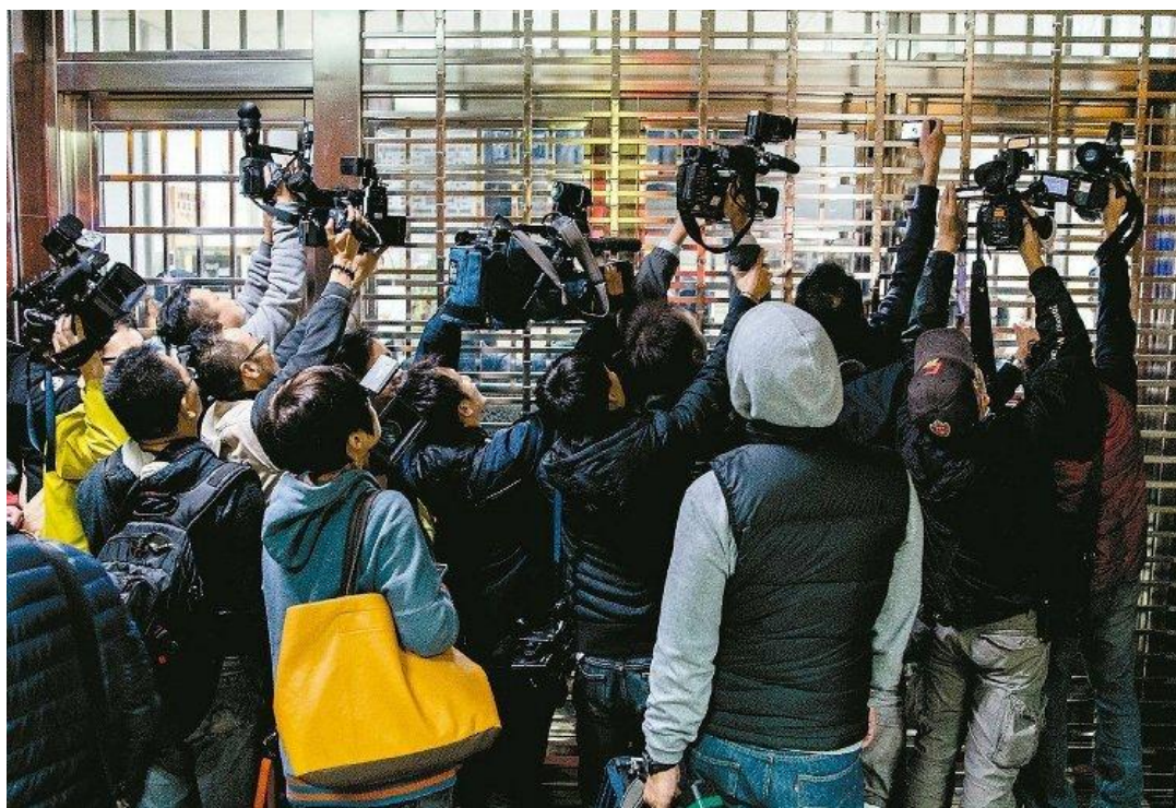
搶拍 混亂凌晨零時許，各家媒體擠在大寮監獄大門口搶拍進出的家屬與警員。