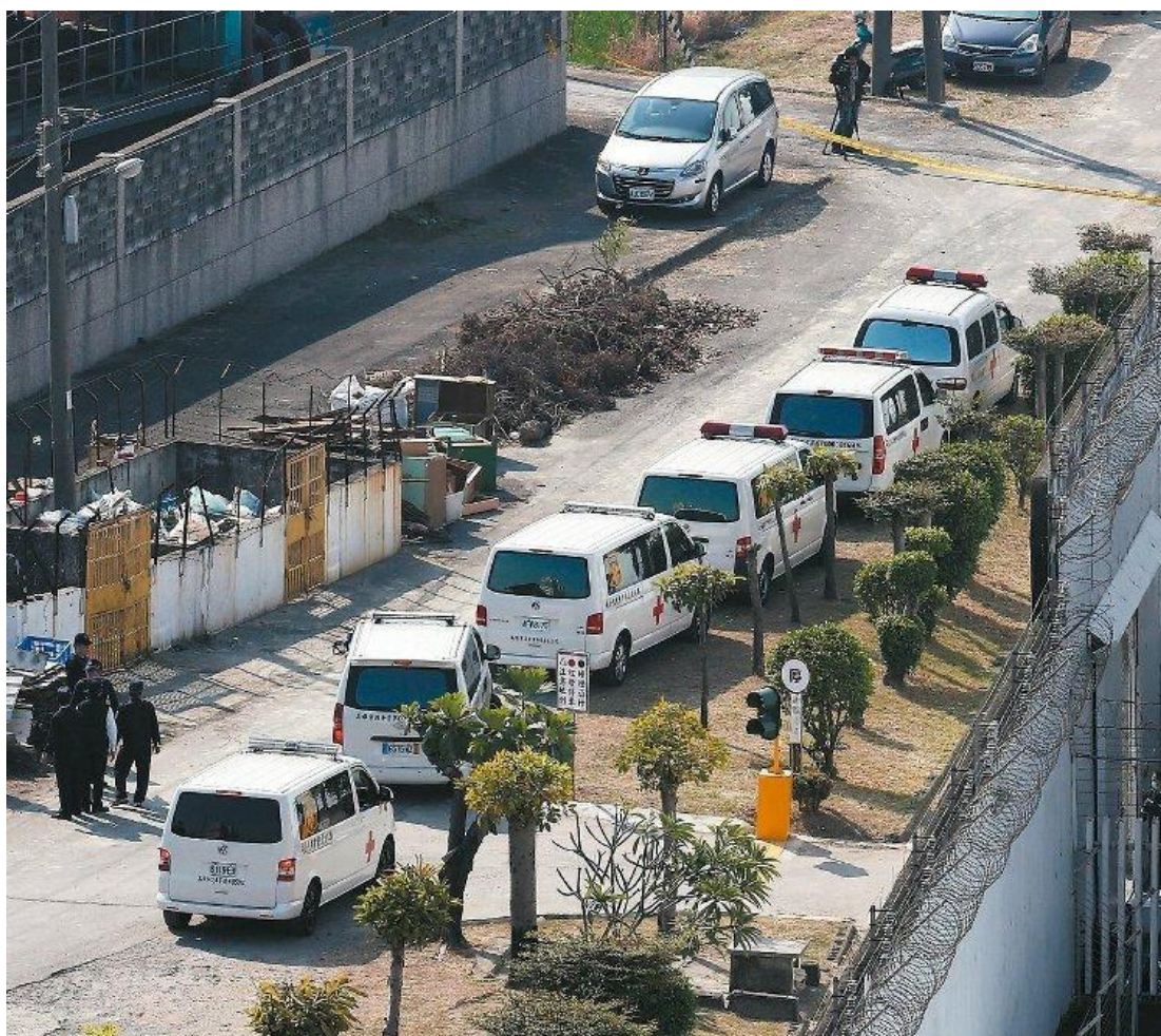
大寮監獄挾持事件落幕，六名囚犯自殺，由救護車載往殯儀館。

兩人之後走回房內，抽著菸，約莫過 20 分鐘左右，再度走到外面，一樣朝太陽穴開槍自盡；根據一張現場照片，六人身體成梅花狀排列，像是同歸於盡，滿地腦漿與鮮血，警方人員進入後，確認 6 人已全部氣絕。清晨 5 點 39 分，天還沒亮，人質典獄長陳世志平安走出來。