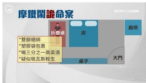
▲男子疑似吸瓦斯輕生。