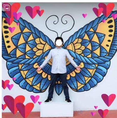
▲吳男臉書上化身成為一隻蝴蝶。

【三立新聞網】 https://www.setn.com/News.aspx?NewsID=482163